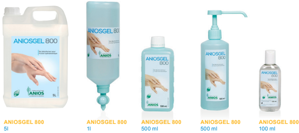
ANIOSGEL 800 5l

Przyjazny dla skóry preparat do dezynfekcji rąk